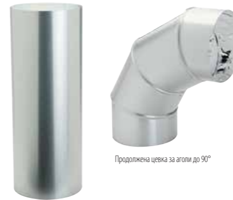
Продолжена цевка за аголи до 90°

Одбојната цевка Spectralight® Infinity има одбивање што е најефективно на светот и изнесува 99,7 %. Кај серијата Brighten Up® на располагање се цевки со пречник 250 мм и 350 мм. Поради препреките на подстрите можат за пренос на сончевата светлина во просторијата да направиме и завоји на цевките со агол до 90°. Можеме да имаме и цевки со должина до 9 м, а притоа да не ја нарушиме ефективноста на осветлување на просторијата. Цевките ги составуваме по делови со должина од 400 мм или 600 мм.